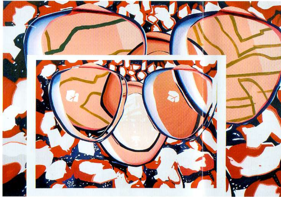
No te miro no te veo. 2010 Acrílico s/ lienzo 155 x 220 cm

Galardonado recientemente también con el Premio Nacional de Arte Gráfico, su obra en papel ha sido una constante. Como colofón de esta muestra, una serie de pequeñas pinturas-collages, sobre papel, de pequeño